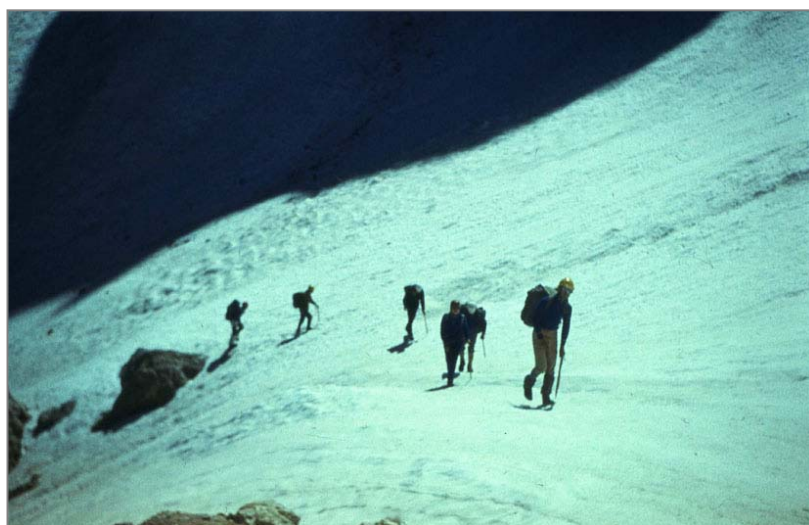
Описываемым событиям предшествовало тренировочное восхождение на вершину М.Ганза (4958)