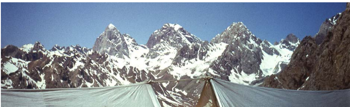
Слева Сахарная голова (4910) с характерной белой шапкой, в центре – Красная Москва (5183)