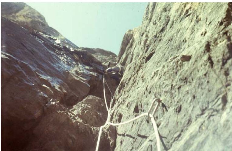
Лазание по внутреннему углу, а рядом течет вода (лидирует А.Гогин)

В гроте у второго контрольного тура мы были около 3 часов дня. Там была лужа грязи и, вообще, неуютно. Я агитировал идти дальше, но Саша сослался на план, на усталость, а также на то, что он сегодня руководитель. Пришлось поставить палатку и пообедать. Солнце было высоко, и мы с Сережей двинулись на обработку. После удачного обеда Сережа был добрый, и я пошел первым. На