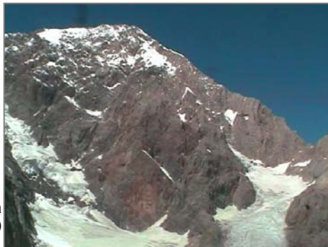
Б.Ганза (5306 м)