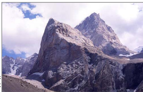
Парандас и Замок