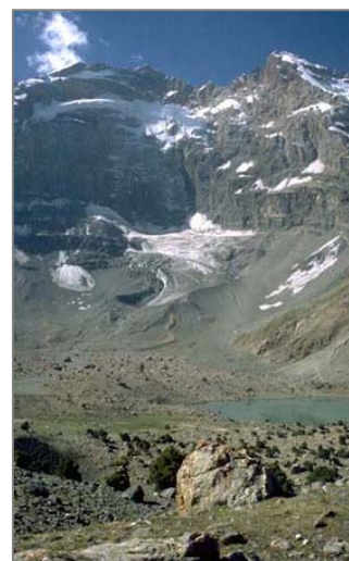
▲ Куликалонская стена