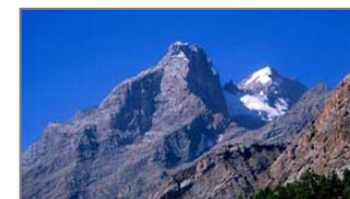
▲ в.Замок и бастион Парандас